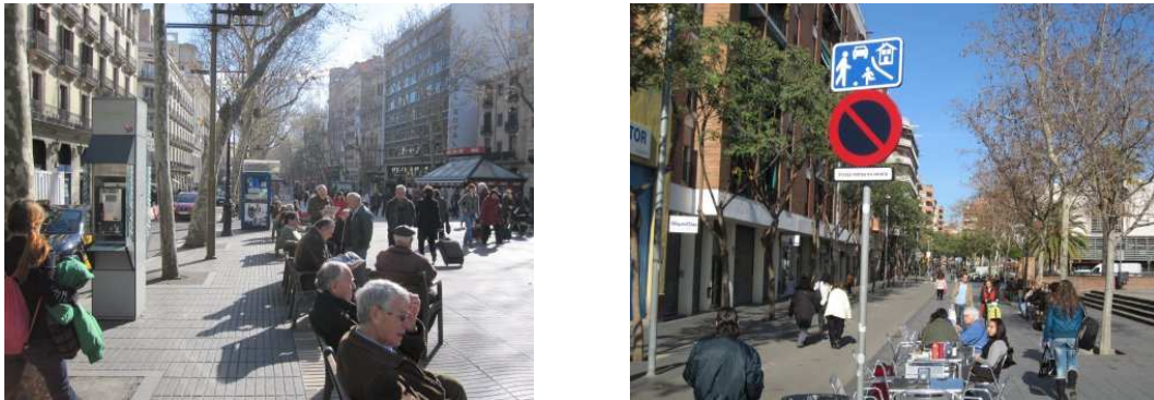
FIGURA 5: Barcelona

no es un espacio peatonal, sino que tiene entre cuatro y seis carriles destinados a los vehículos motorizados (circulación y aparcamiento).