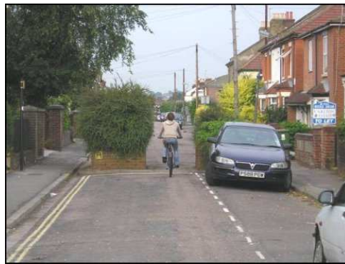
FIGURA 8: Southampton (Reino Unido)

Si bien los cambios de sentidos de circulación pueden hacerse en un primer momento de forma muy económica (simples modificaciones en la señalización vertical y horizontal), con el tiempo se pueden ir mejorando y basando en elementos de mobiliario urbano que no precisen de señalización y que aporten aspectos positivos al espacio público. Es el caso, por ejemplo, de la FIGURA , donde se muestra que las jardineras dividen los dos tramos de una calle con sentidos de circulación opuestos. Obsérvese que los sentidos de circulación atienden únicamente al tráfico motorizado, posibilitando siempre el paso de peatones y bicicletas, los cuales han de poder desplazarse por dentro de la celda siguiendo el camino más corto.