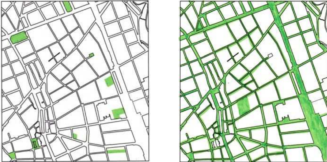
FIGURA 2: Centro de Sabadell

A la izquierda, espacios para el juego. A la derecha, espacios para la movilidad, incluyendo carriles de circulación de vehículos motorizados, aceras, calles peatonales, aparcamientos en superficie y carriles bici.