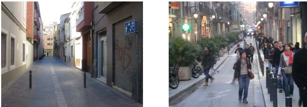
FIGURA 3: Sabadell y Barcelona

cabe señalar que si bien es cierto que esta calle puede considerarse atractiva por la gran presencia de personas y comercios, también lo es que fundamentalmente sólo sirve a una función: el desplazamiento.