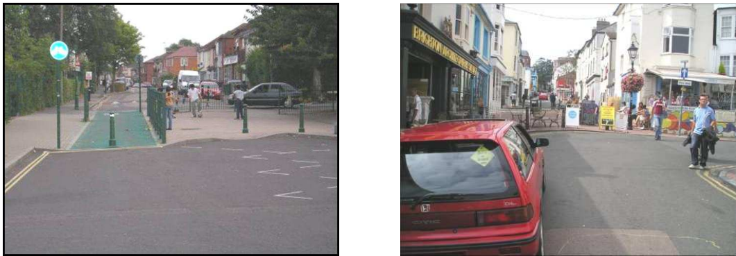
FIGURA 10: Southampton y Brighton (Reino Unido)