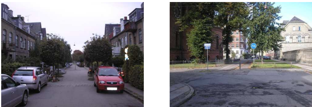
FIGURA 11: Copenhague (Dinamarca)