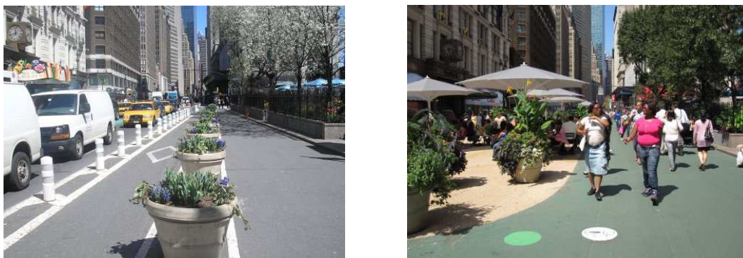
FIGURA 12: Antes y después en Herald Square, New York (EEUU)

Así, los beneficios de apostar por estas actuaciones blandas no únicamente son su posibilismo desde el punto de vista económico, sino que a su vez hacen creíble que se trate de una prueba piloto que puede ser retirada o modificada si así se decidiera finalmente.