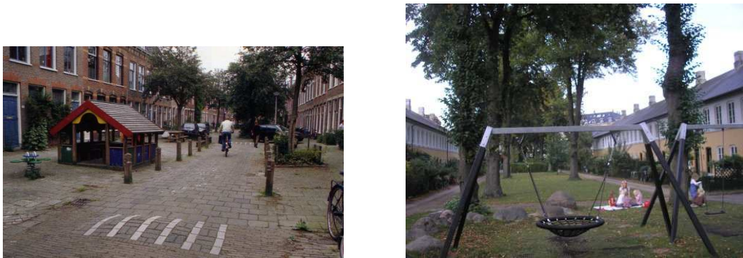
FIGURA 6: Groninga (Países Bajos), fotografía de A. Sanz, y Copenhagen (Dinamarca)

Otros ejemplos aún más clarificadores son las fotos de la FIGURA , de calles que sirven a todas las funciones (excepto al paso de tráfico motorizado en la fotografía de la derecha).