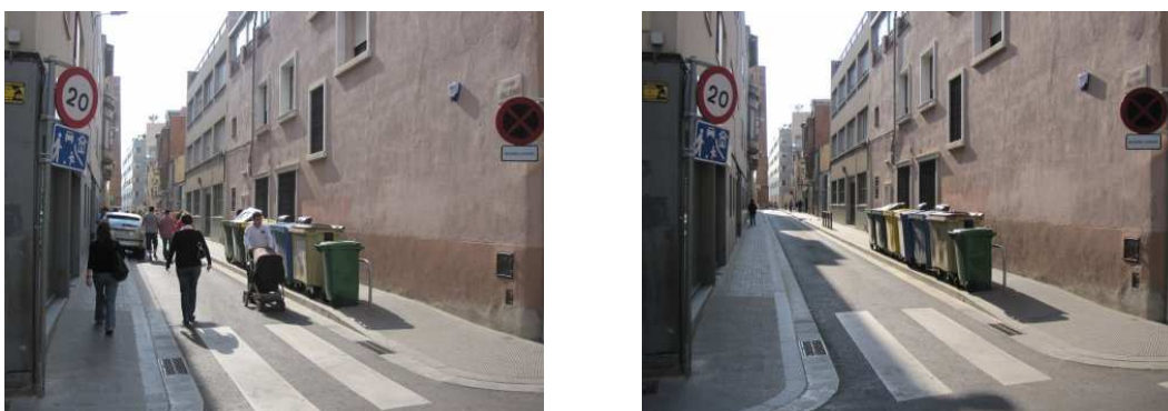
FIGURA 4: Sabadell

Pero resulta claro que la señalización no puede conseguir por sí sola un efecto que el diseño urbano de la calle (recién inaugurada en 2009) contradice. Seguramente se estará de acuerdo en que ni la calle invita a jugar o a hacer deporte, ni nada hace intuir una prioridad peatonal en la calzada, ni tampoco se induce a los conductores a circular a 20 km/h, sino a mayor velocidad. En definitiva, un diseño inadecuado acaba con las expectativas que se le asignan a la calle. De hecho, el único momento en que esta calle incita a circular a velocidades reducidas es durante las entradas y salidas del alumnado de la escuela que ahí se encuentra, momento en que la gran presencia de personas invade la calzada (sobre todo por la previa ocupación de las aceras por parte de los coches de los propios padres). Por lo tanto, es la propia presencia de gente el elemento moderador de la velocidad, efecto que surge de facto , independientemente del diseño de la calle. Ahora bien, esto no convierte a la calle en un espacio acogedor, ni tan solo en estos momentos puntuales del día, pues resulta evidente que la calle expulsa. Muestra de ello es que pocos minutos después de la salida del alumnado la calle vuelve a quedar desierta, sin ninguna actividad más que la de los pocos coches o peatones que la atraviesan para pasar de largo.