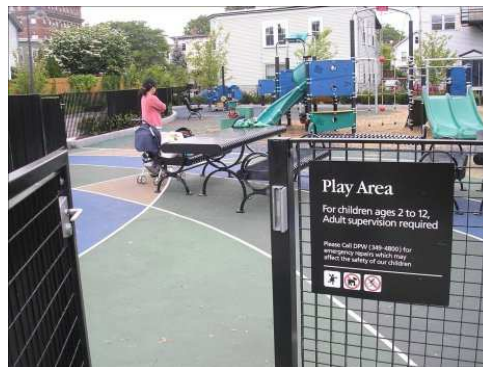
FIGURA 1: Áreas de juego en Barcelona y Cambridge (EEUU)

Así, en la ciudad de tránsito se infravaloran actividades y funciones que en la ciudad hogar se pretenden potenciar y poner al mismo nivel que la función de desplazamiento. La ciudad hogar consiste precisamente en generalizar al conjunto del espacio urbano las funciones urbanas infravaloradas por la ciudad de tránsito, devolviéndolas a su espacio natural por excelencia (delante de casa, de la escuela, siempre en gran proximidad) y rescatándolas del confinamiento al que están siendo sometidas. Ante la propuesta de la ciudad hogar, la primera pregunta que fácilmente puede surgir es si podemos compatibilizar la generalización de actividades como el juego y la reunión con el desplazamiento. Dar una respuesta claramente afirmativa a esta pregunta es precisamente uno de los objetivos de este artículo. En concreto, el presente artículo comienza por exponer algunos ejemplos y reflexiones sobre diferentes calles y sus usos